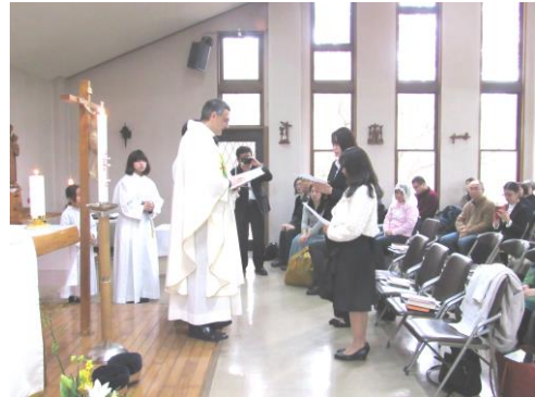
ルカ神父様から祝福を受ける