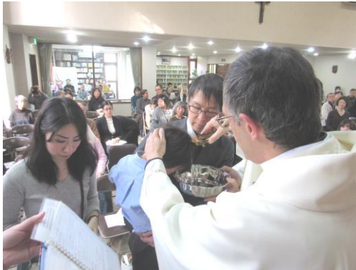
ルカ神父様から幼児洗礼を受ける