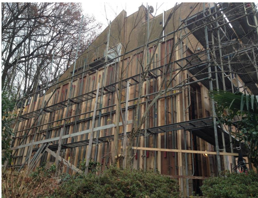
12月 地下1階鉄筋組み立て・型枠工事