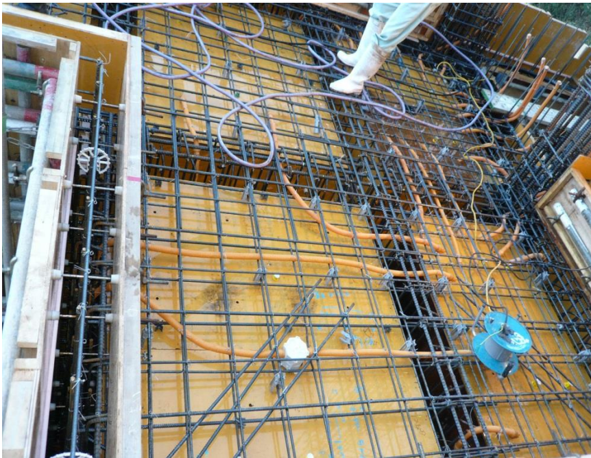
12月28日 地下1階コンクリート打設