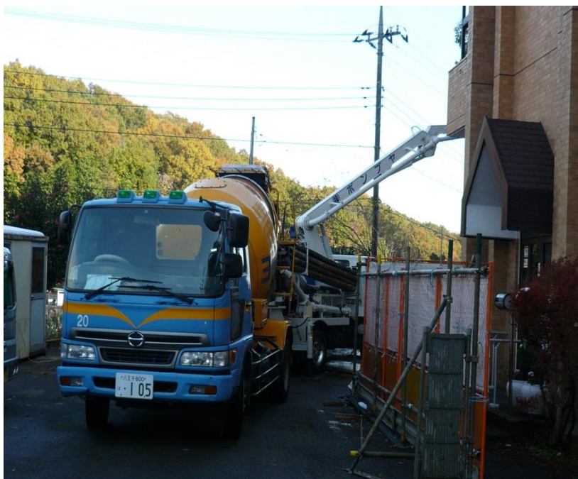
コンクリートポンプ車